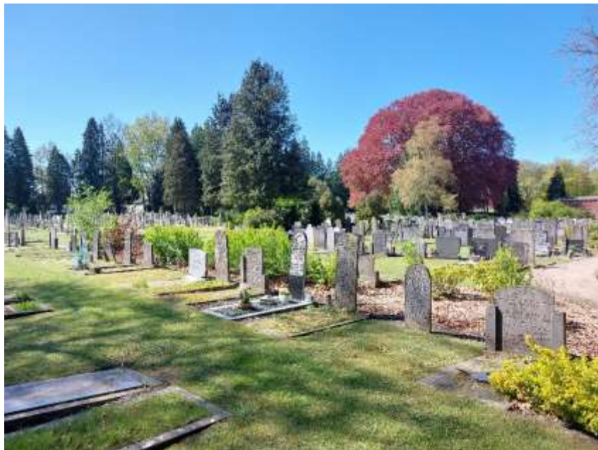
Algemene Begraafplaats aan de Meppelerweg in Steenwijk.