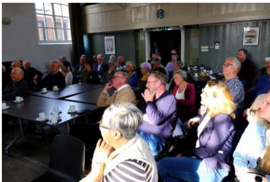
Veel belangstelling bij de vrijwilligersbijeenkomst.

Het is nu aan de nieuwe coalitie die binnenkort wordt gevormd hoe dit verder wordt opgepakt. In het 4 e kwartaal 2026 zal hier waarschijnlijk meer duidelijkheid over zijn. Al met al weer een forse vertraging van het project.